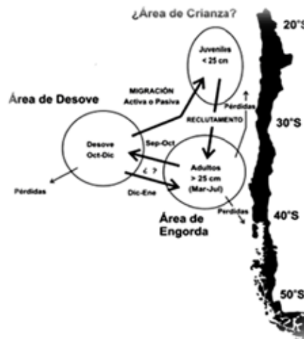
Figura 2. Modelo conceptual de la distribución de jurel frente a las costas de Chile en condiciones normales (Arcos et al., 2002).

Este estudio expone que la población juvenil del jurel "se acorraló" en el sector centro-sur (zona de intensa pesquería) debido a las malas condiciones de las aguas del norte (más cálidas durante "El Niño") en donde se explotó una fracción de la población indebida, representada por capturas de individuos de menos de 26 cm de longitud, con lo cual no se pudo regenerar el stock comercial los años posteriores disminuyendo los desembarques y provocando los estragos por todos conocidos. Esto queda ilustrado en las figuras 2 y 3.